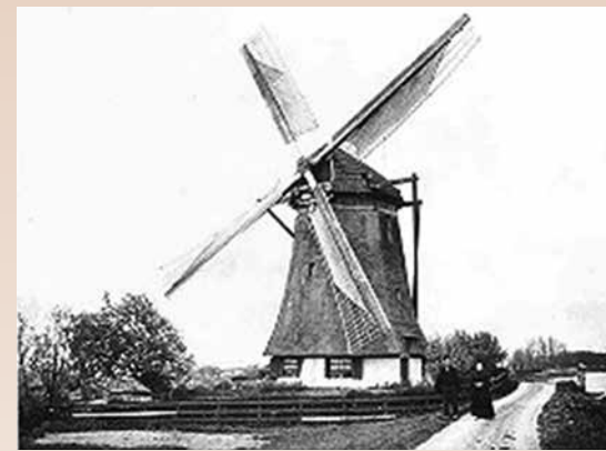
Een achtkantige watermolen